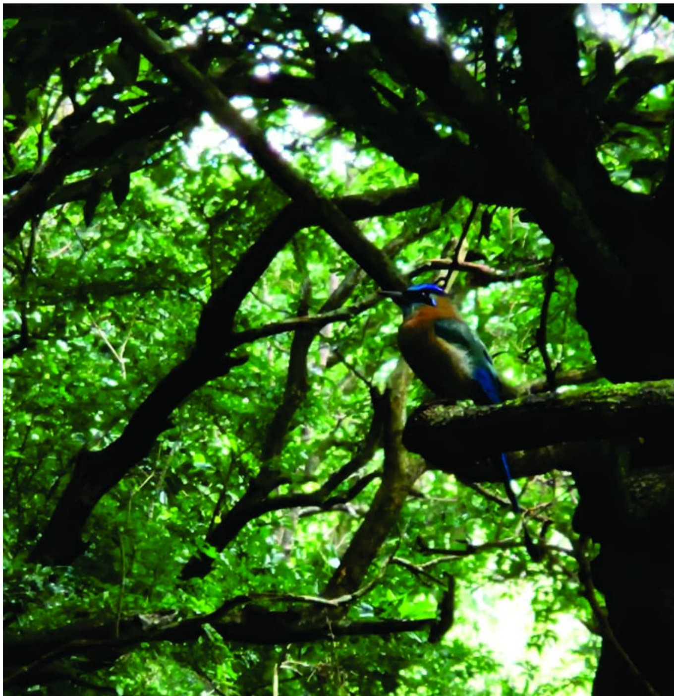
Lenochod v certifikované záchranné stanici