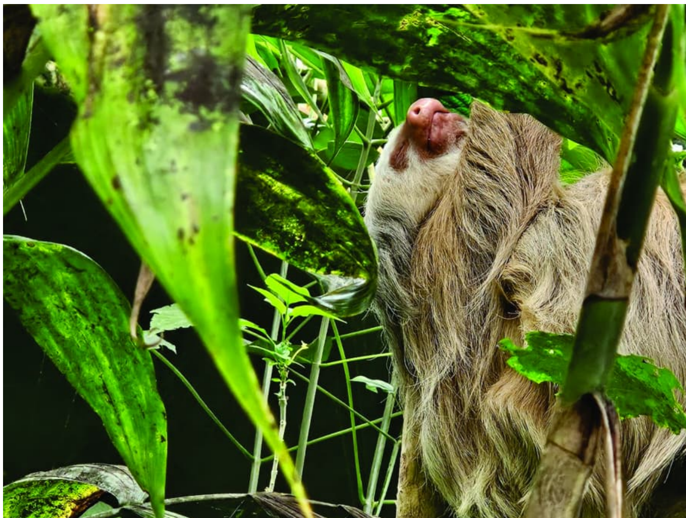
Pozorování lenochoda v národním parku