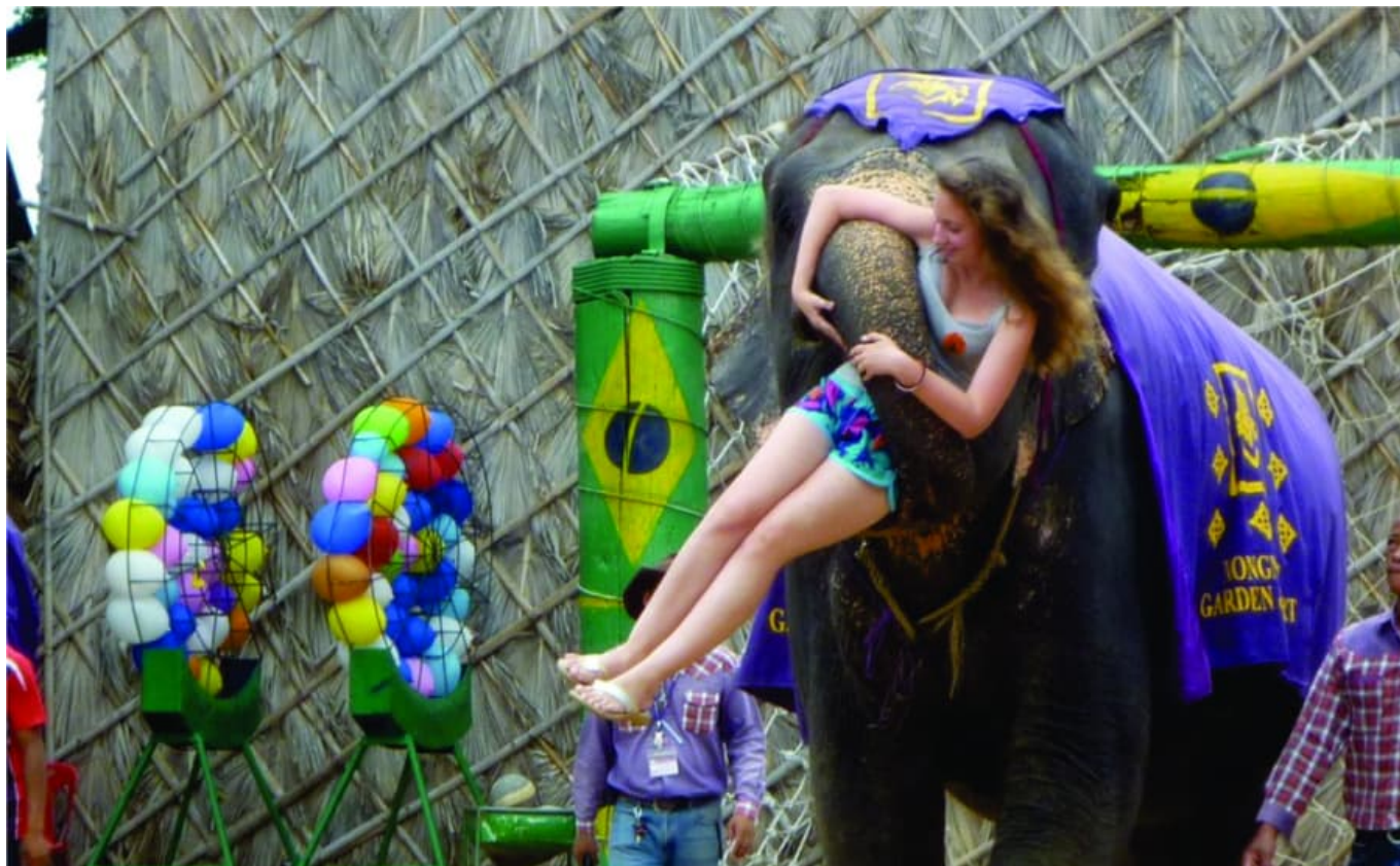
Nošení břemen způsobuje slonům bolest páteře a kloubů